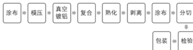
铝箔纸、转移纸工艺流程 ②